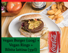
Menu Vegan Burger

Vegan Burger (120g) + Vegan Rings + Bibita lattina (33cl)