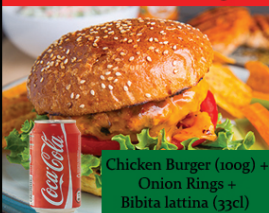
Menu Chicken Burger

Chicken Burger (100g) + Onion Rings + Bibita lattina (33cl)