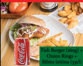
Menu Fish Burger

Fish Burger (160g) + Onion Rings + Bibita lattina (33cl)